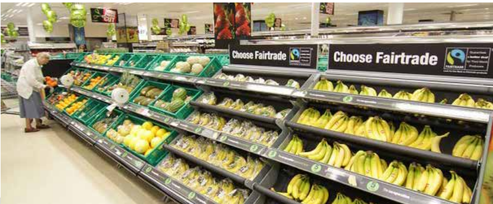
Bananhyllan hos Co-op i Storbritannien.

Parallellt med den hårda prispresen finns det alltså goda exempel på viktiga hållbarhets-satsningar, såsom att vissa dagligvarukedjor väljer att sälja enbart Fairtrade-märkta bananer. Det är den här typen av konkreta åtaganden som gör stor skillnad för odlare och anställda – och visar på vilken potential som finns även på den svenska konsumentmarknaden.